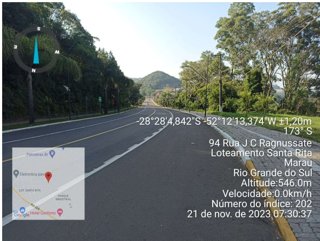
Avenida Júlio Borella – Centro/Trevo Sul